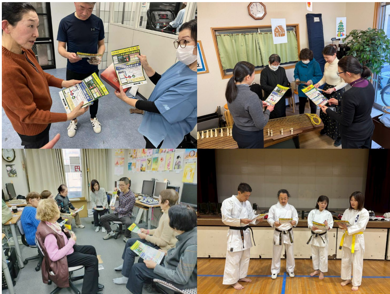
＜防犯啓発実施の様子＞

教室内では、最新の特殊詐欺に関する動画視聴や、防犯チラシの配布および教室内への設置を行いました。講師という身近で信頼される存在から直接伝えられることで、生徒が詐欺被害をより現実的な問題として捉えるきっかけにもつながっています。